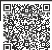
Figure 4 Standalone

Kompletní nabídku 3D technologií pro Českou a Slovenskou republiku naleznete na www.Abc3D.cz