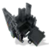
TOUGH-GRY 10 Technický vysokorychlostní pevný šedý plast.

Při uvedení na trh (2018-10) jsou k dispozici dva technické, jeden flexibilní a jeden odlévatelný materiál. V následujících měsících budou uvedeny další.