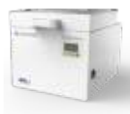
LC-3DPrint Box UV komora pro zajištění finálního vytvrzení výtisku.