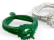
JCAST-GRN Pevný zelený snadno odlévatelný materiál.