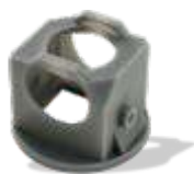
TOUGH-GRY 15 Technický pevný šedý plast pro detailní výtisky.