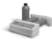
LC-3D Mixer Pro promíchání materiálu v lahvi před použitím.