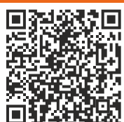
Omni 500 Lite

Kompletní nabídku 3D technologií pro Českou a Slovenskou republiku naleznete na www.Abc3D.cz